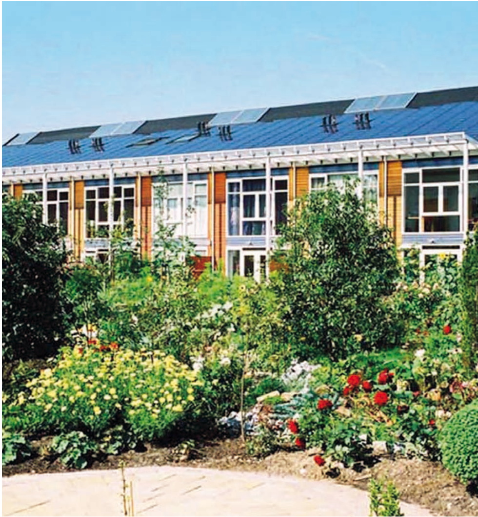
EVA Lanxmeer, Quartiere (Culemborg, Holland), arkitekt Joachim Eble.