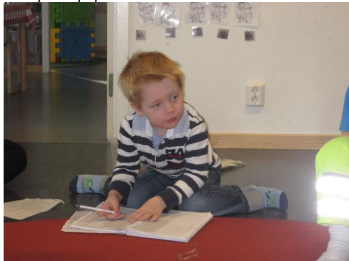
Barn kan också leda en samling och fylla i närvaro...

Flera teman har direkt utgått från barns önskemål och som tidigare nämnts har bygg och konstruktionslek varit mycket populärt.