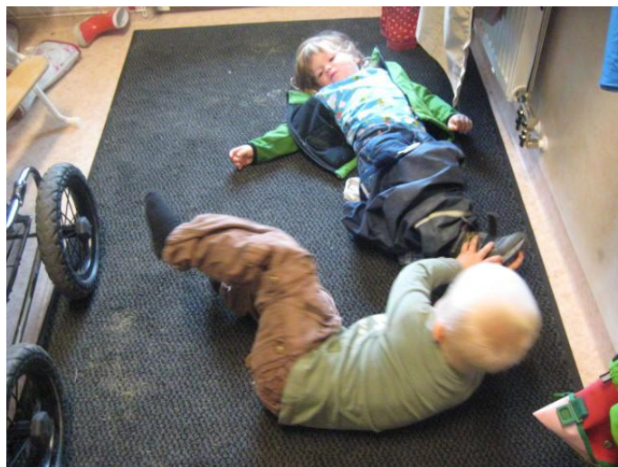
Man kan hjälpa varandra...

värden under nästa läsår. Hittills har vi använt oss av "Tilda med is och sol" och "Vännerna i konungaskogen" men vi tittar också på lite nya material för att få nya infallsvinklar. Dessutom ska vi bli bättre på att utforma likabehandlingsplanen tillsammans med barnen och uppdatera handlingsplanen inför varje läsår.