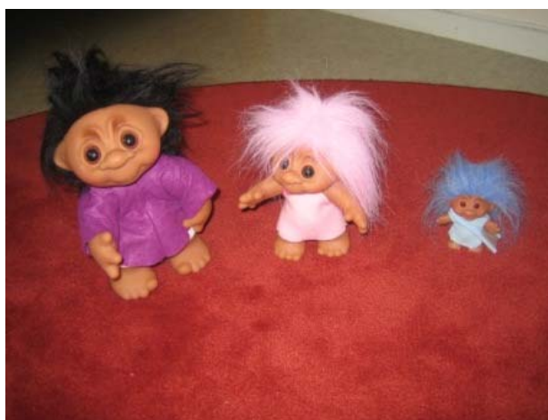
”Liten, mindre, minst”

Vi på småbarnsavdelningarna känner att vi arbetar aktivt med barnens språkutveckling och möter barnens behov. Vi ser vikten av att barnen får höra sagor och vi har läshörna med lättillgängliga böcker som barnen kan titta i tillsammans med andra barn eller själva. Vi ser att barnets ordförråd och ordförståelse ökar när vi läser för dem. Vi använder inga slanguttryck och uppmuntrar barnen till att samtala med riktiga ord. Barnen visar stor uppskattning för rim och ramsor och vi tycker att det är roligt!