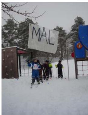
Årligt Fagerhultslopp på skidor eller springandes

Ankan och Grodan bedömer att de gör ett bra arbete i dagsläget, men de vill arbeta mer med rörelse både inomhus och utomhus, samt fortsätta använda sig av Röris-materialet.