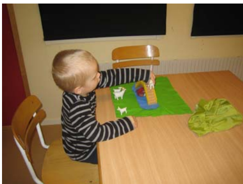
"Bocken går över bron och trollet sitter under bron."

Lindens avd. bedömer att målet är uppfyllt till 100 %